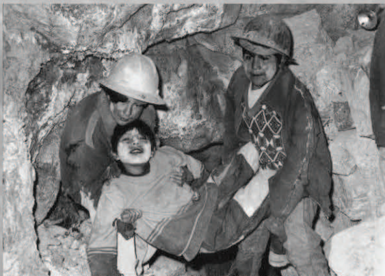
Quand les enfants s'évanouissent de faim et de peur à plus de 1'000 mètres au fond de la mine...